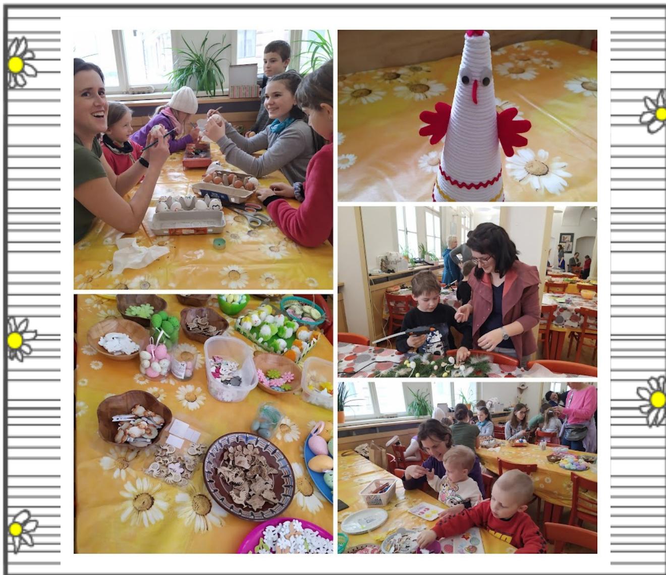
Velikonoční rodinná dílna