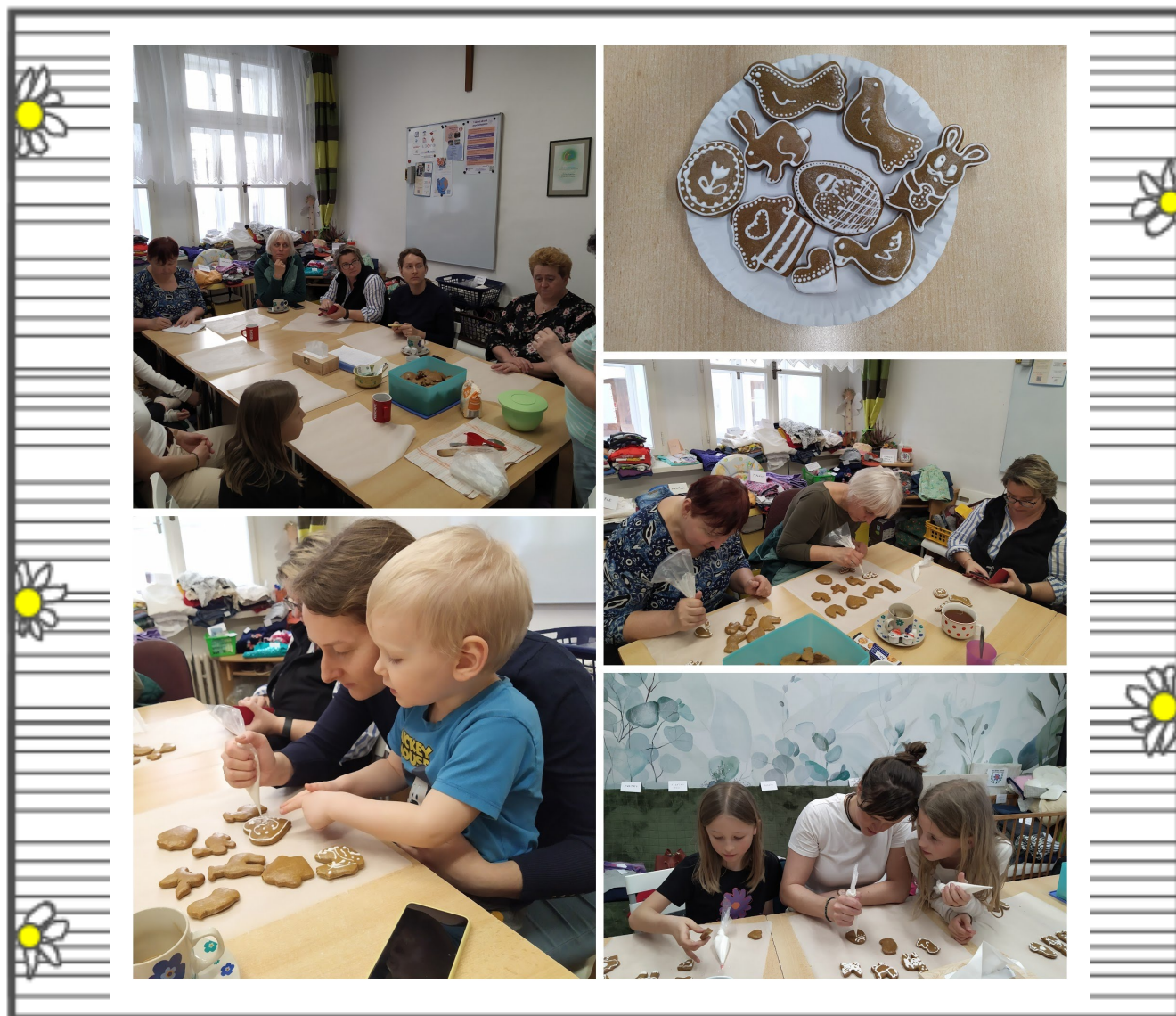
Zdobíme velikonoční perníčky